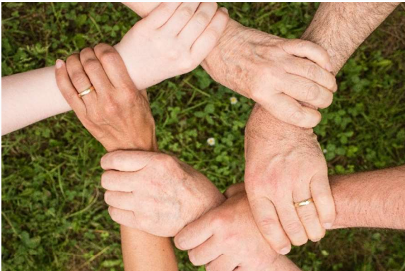
Betriebskooperationen in der Region Feldbach

AUF GESUNDHEITSKURS gesundheitskompetenz in Feldbach