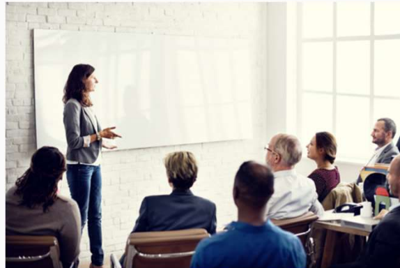
Schulung für Führungskräfte und MultiplikatorInnen in Betrieben