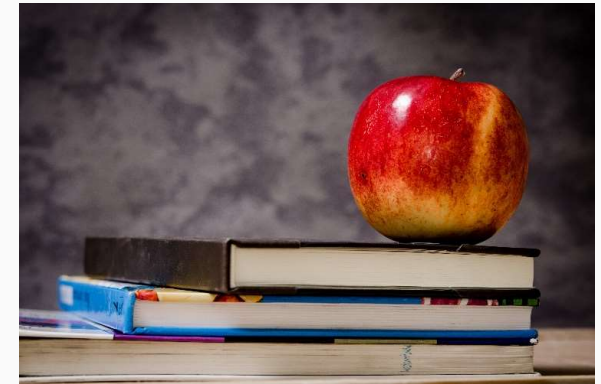
Begleitung der Umsetzung von Kleinprojekten in Betrieben